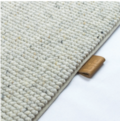
new beige 5208